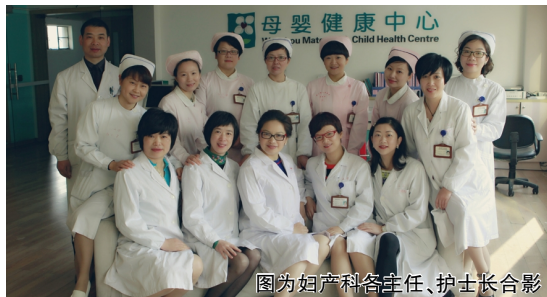
图为妇产科各主任、护士长合影

日前,我院妇产科被中华全国总工会授予“全国五一巾帼标兵文明岗”称号。我院妇产科规模大、床位多、患者流量大。该科室医务人员积极发扬爱岗敬业的精神,心系患者,以高超的医术、优质的服务,为广大妇女同胞解除病痛。