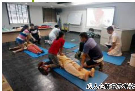
成人心肺复苏考核