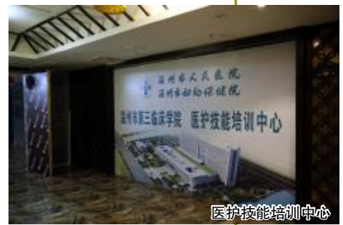
医护技能培训中心