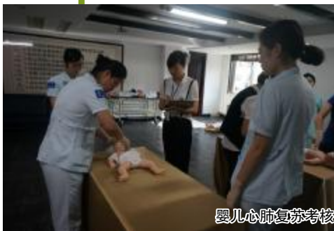
婴儿心肺复苏考核