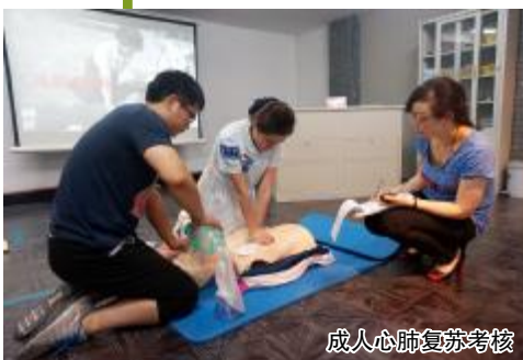
成人心肺复苏考核