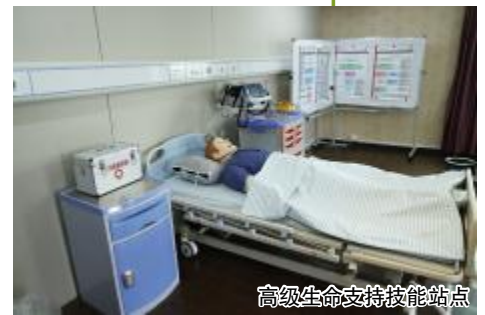
高级生命支持技能站点